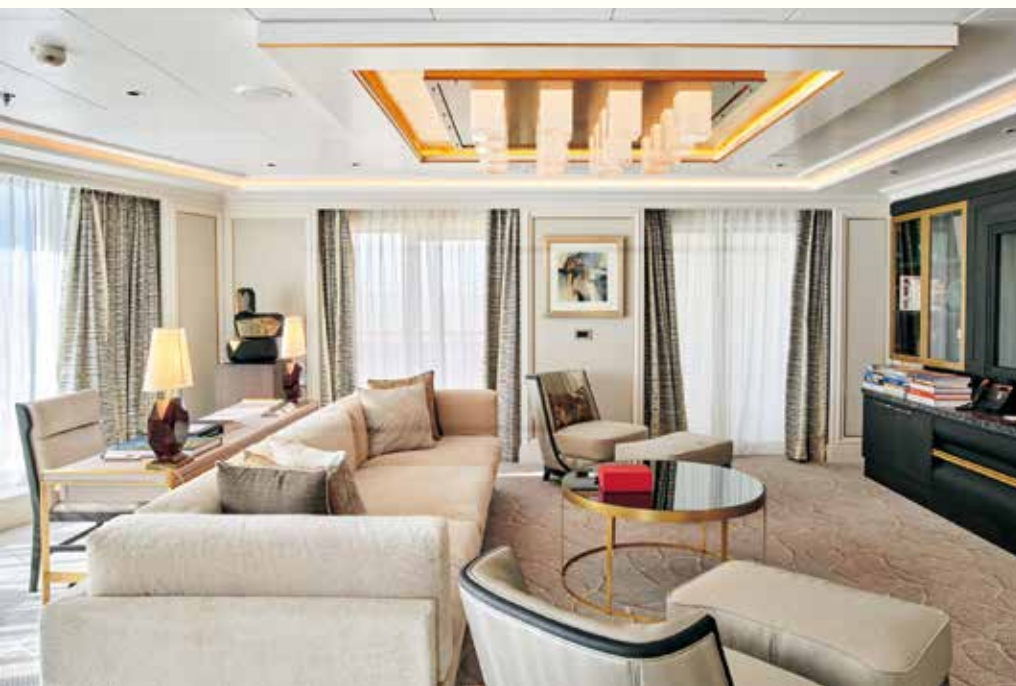
リージェントスイートのリビングルーム。使い勝手のよい配置なので、つい人を招きたくなりそう