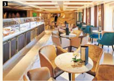
1 踊り場もじゅうたん、ガラス、手すり、間接照明とすべてが美しくデザインされている 2 プールデッキの奥まった場所には誰もがゆったりとくつろげるソファを配置 3 レセプションのフロアにある「コーヒー・コネクション」。テラス席もあり、バリスタが入れるコーヒーがおいしい