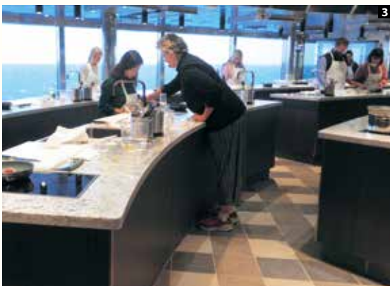
1「メリディアンラウンジ」でのアフタヌーン・ティー。カートには多彩なスイーツが 2 ジャクジーに入っていると「シャンパンはいかがですか」とウエーターが気を利かせてくれる。知らない乗客ともドリンク片手に話が弾む 3「カリナリーアートキッチン」ではクルーズエリアの素材や名物料理を習うことができるので、クルーズ後は自宅で腕を振るえる

インフィニティ・プールのあるスパや船首のオブザベーション・ラウンジ、おしゃやれなショップでの買い物など、楽しみは尽きない。