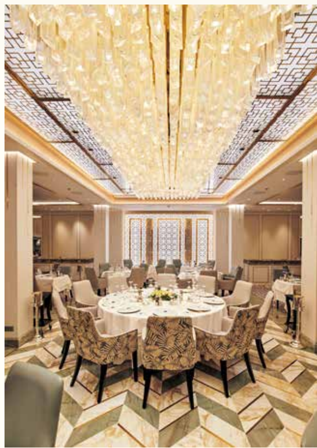
メイン・ダイニング「コンパス・ローズ」。中央には鍾乳洞のような形の吹きガラスで作られたシャンデリアが