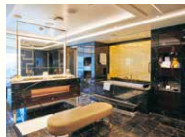
総大理石のバスルーム