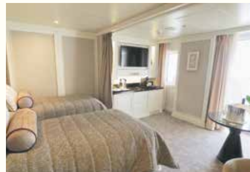
「ベランダスイート」(約28平方メートル)でも このスペース。バルコニーも十分な広さ