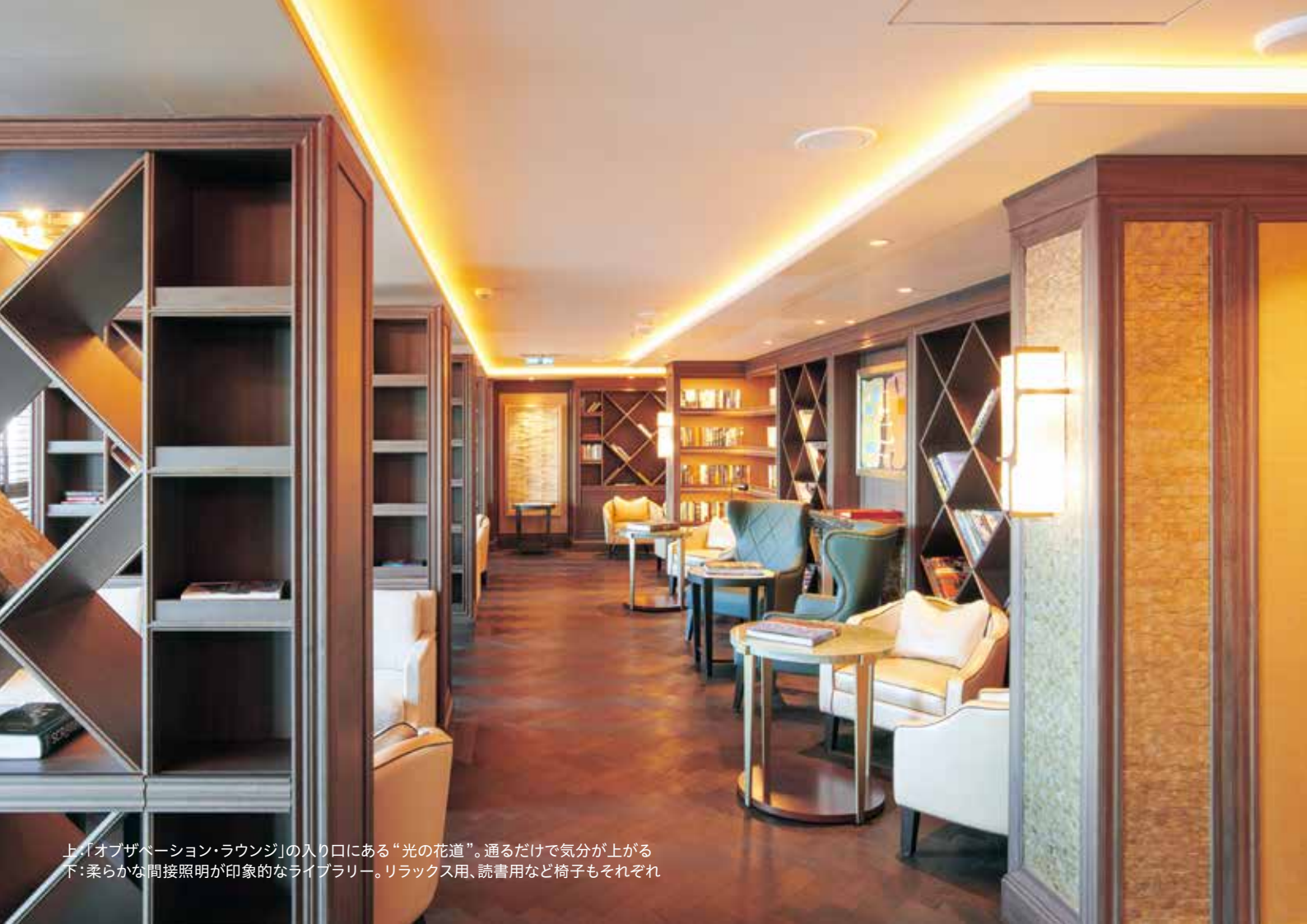
上:「オブザベーション・ラウンジ」の入り口にある“光の花道”。通るだけで気分が上がる 下:柔らかな間接照明が印象的なライブラリー。リラックス用、読書用など椅子もそれぞれ